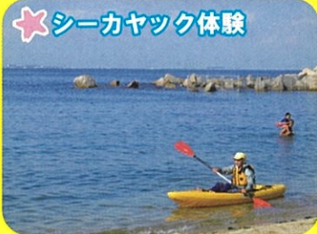
★シーカヤック体験