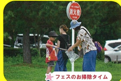
★フェスのお掃除タイム