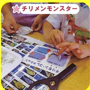
★チリメンモンスター