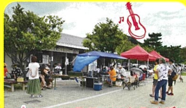
★アコースティックライブ 吹奏楽やバンドみんなで奏でるよ～