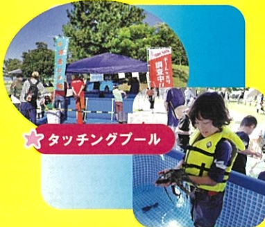
★タッチングプール