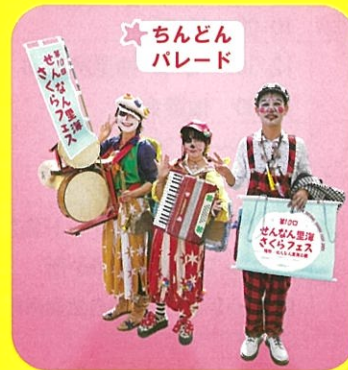
★ちんどん バレード