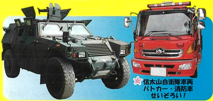
★信太山自衛隊車両 バトカー・消防車 せいぞろい！