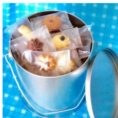
パケツ缶入りクッキー (ナカイ製菓)