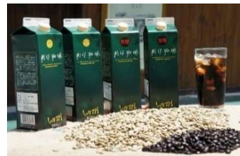
アイスコーヒー(株式会社 WITH)