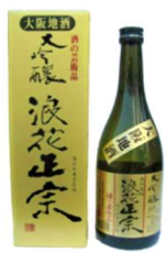
大吟醸浪花正宗 (浪花酒造有限公司)