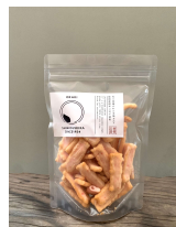
スタンドバック OKAKI (新興製菓有限公司)