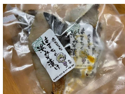
はまちの浜みそ漬け (浜のおばちゃん家)