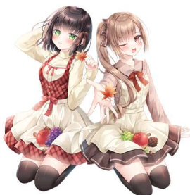
美海&さくら運営委員会