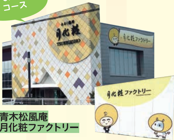
青木松風庵 月化粧ファクトリー